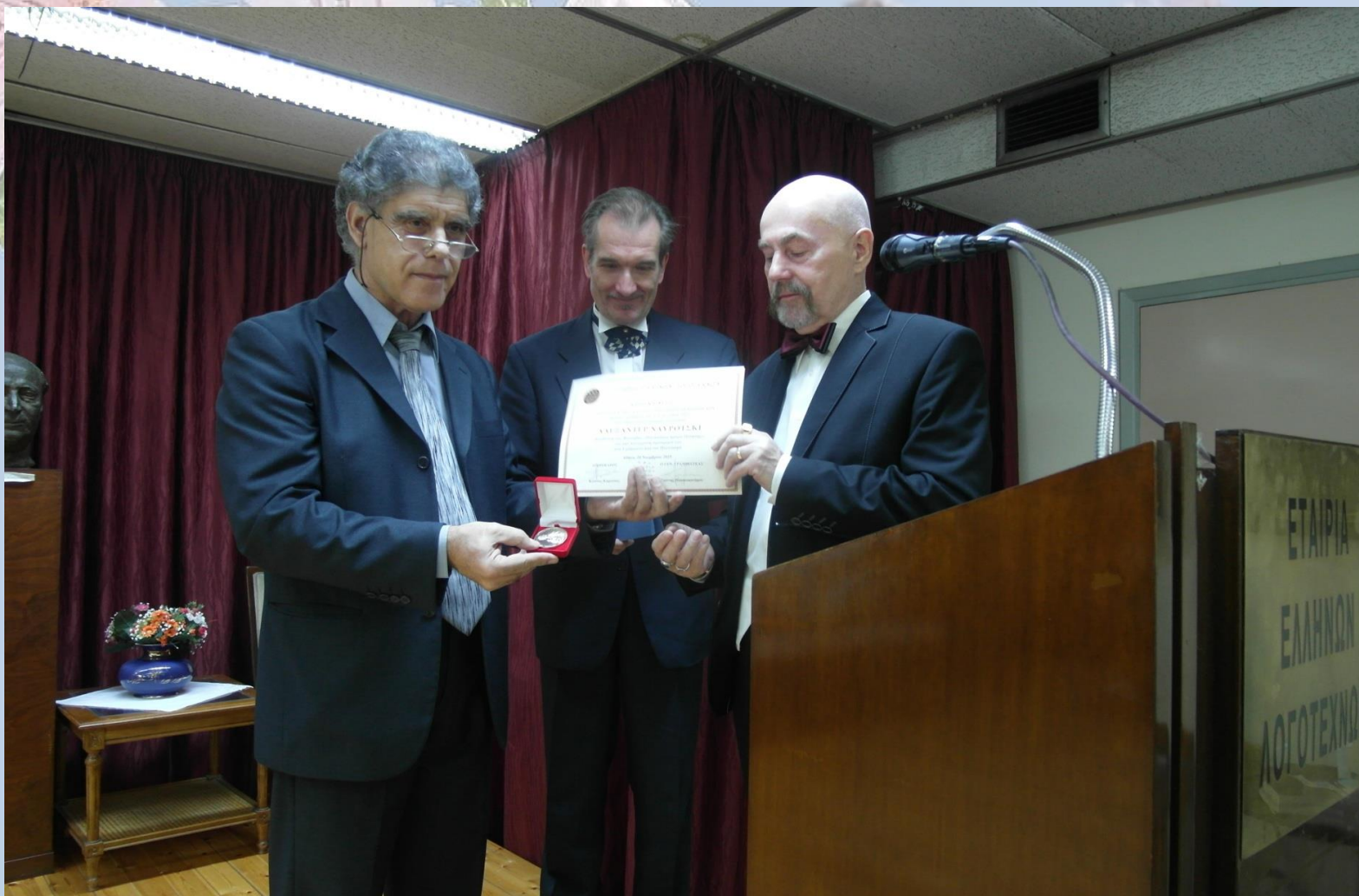
Medal Związku Pisarzy Greckich - 2015